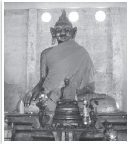
พระพุทธรูปลีหังค์ วัดพระพุทธรูปลีหังค์ อ.นาโยง จ.ตรัง

ดังนั้นตำนานนางเลือดขาวจึงเป็นตำนานทางประวัติศาสตร์ท้องถิ่นที่แพร่กระจายอยู่ในบริเวณท้องที่จังหวัดพัทลุง นครศรีธรรมราช สงขลา และตรัง ซึ่งได้รวมเอาตำนานที่อธิบายเกี่ยวกับสถานที่เข้าปะปนเข้าไว้ด้วยกัน จึงดูเป็นเรื่องเกินความจริงยากที่จะเชื่อถือเป็นข้อเท็จจริงทางประวัติศาสตร์ได้ แต่อย่างไรก็ตามในสิ่งที่เป็นตำนานนั้นย่อมจะมีข้อเท็จจริงแอบแฝงอยู่ด้วยอย่างแน่นอน โดยตำนานนางเลือดขาวนั้นนอกจากจะเป็นเรื่องราวที่มีอิทธิพลต่อการสร้างประวัติศาสตร์และโบราณคดีในพื้นที่ต่างๆ ของภาคใต้แล้ว ก็ยังมีอิทธิพลต่อวัฒนธรรม ขนบธรรมเนียม ประเพณี ความเชื่อของชาวใต้อีกด้วย จึงถือได้ว่าเป็นนิทานหรือตำนานที่มีความสำคัญ และน่าสนใจอย่างยิ่งต่อการศึกษาประวัติศาสตร์ประเภทตำนานในท้องถิ่นภาคใต้ และควรค่าแก่การพัฒนาต่อยอดให้เกิดเป็นเส้นทางการท่องเที่ยว “เยือนแหล่งตำนานพระนางเลือดขาวในภาคใต้” ต่อไป ซึ่งทุกฝ่ายควรจะต้องตระหนักถึงคุณค่าของทุนทางสังคมและวัฒนธรรมที่มีอยู่ในตำนานพระนางเลือดขาวดังกล่าว และนำไปสู่การพัฒนาต่อยอดด้านการท่องเที่ยวเชิงประวัติศาสตร์และวัฒนธรรมที่สำคัญของภาคใต้ต่อไปในอนาคต เพื่อเป็นอีกหนึ่งตัวเลือกแก่นักท่องเที่ยวทั้งชาวไทยและชาวต่างชาติในการท่องเที่ยว เพื่อพิสูจน์และตามรอยตำนานพระนางเลือดขาวในภาคใต้ของไทย ซึ่งมีมนต์ขลังและชวนติดตามไม่แพ้ตำนานพระนางเลือดขาวแห่งเกาะลังกาวิแต่ประการใด